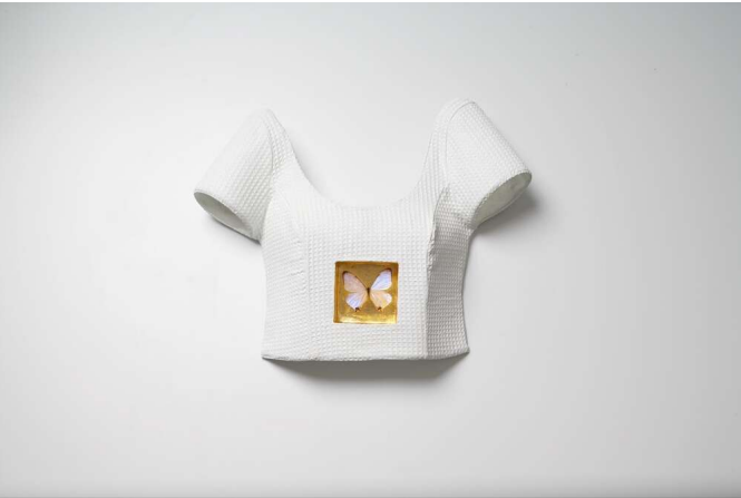
kleiner Schmetterling 1-3, 07 Stoff, Glasfaser, Lack, Blattgold, Schmetterling