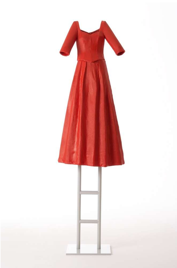
Leiterfrau, 08 Stahlleiter, durchs Kleid durchgehend, pulverbeschichtet, Stoff, Glasfaser, Lack Höhe variabel bis zu 4 m.