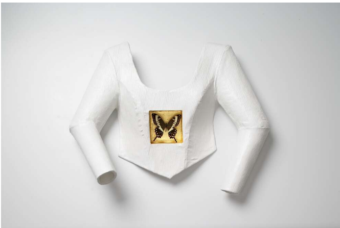
„papillon“, 07 Stoff, Glasfaser, Lack, Blattgold, Schmetterling