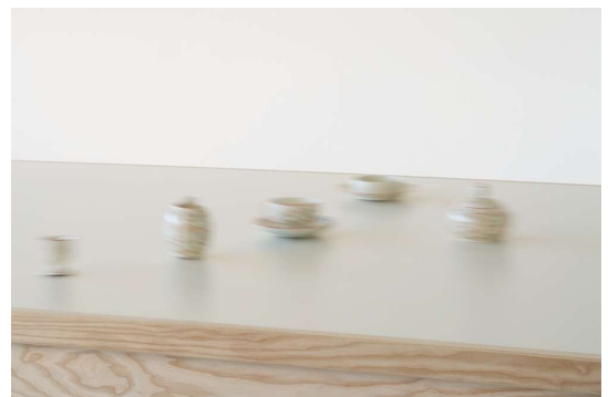
Kaffeetisch (Version 06-08) + Detailaufnahmen in Bewegung Holztisch, kinetische Stahlkonstruktion mit Motoren und Magneten, Kaffeesevice, Sensor. Das Geschirr bewegt sich über den Tisch, sobald sich ihm ein Besucher nähert.