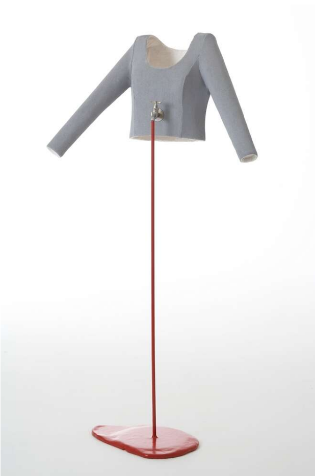
„Auslaufmodell“, 2008 Stoff, Glasfaser, Giessharz, Stahl, Lack, etc. Höhe ca. 140 cm