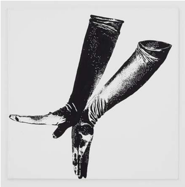
„Gesten“ ( fallenlassen), 08 Acryl auf Leinwand, 100cm x100 cm