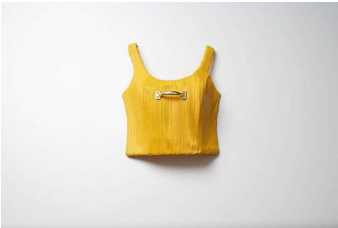
griffbereit 1 (1-3) Stoff, Glasfaser, Lack, Möbelbeschläge