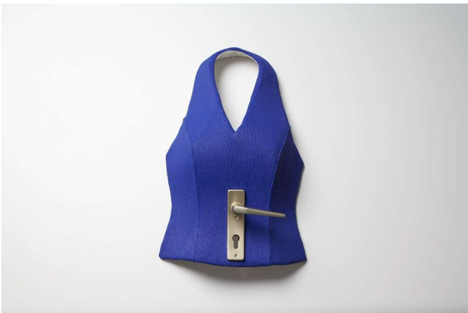
Blaues Wunder (1) Stoff, Glasfaser, Lack, Türgriff