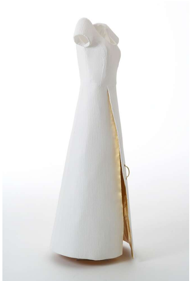
„katholisches Kleid“, 2007 Stoff, Glasfaser, Möbelgriff, Blattgold H. 150 cm