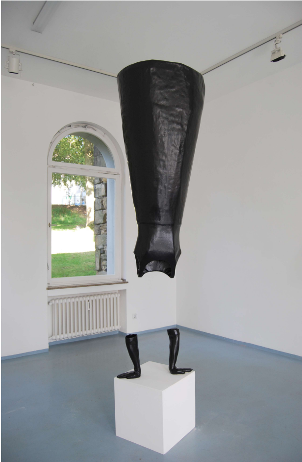
„Kopfüber“, 07 Figur und Handschuhe aus GFK, H 155 cm, B 65 cm, T 65 cm, Gewicht ca 10 kg