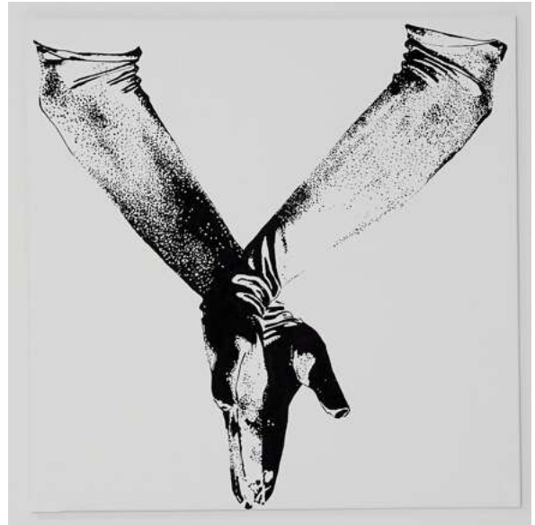
„Gesten“ (festhalten) 08 Acryl auf Leinwand, 100cm x100 cm