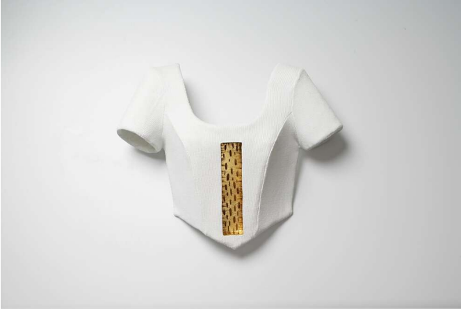
„innen wie außen“, 08 Stoff, Glasfaser, Lack, Blattgold, Dornen