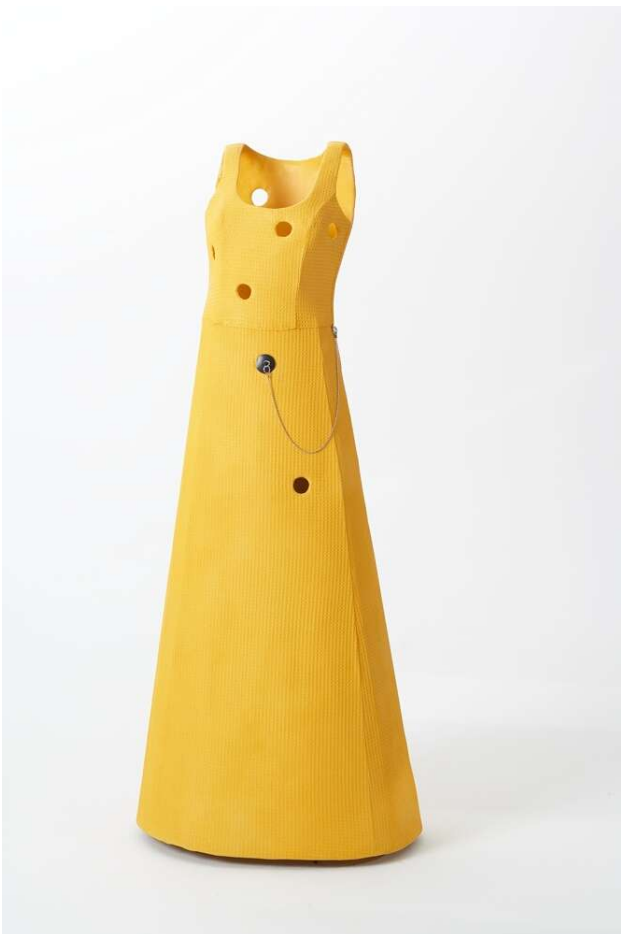
Käsefrau, 08 Waffelpiqué Stoff, Lasfaser, Waschbeckenstöpsel, Lack. H 150 cm