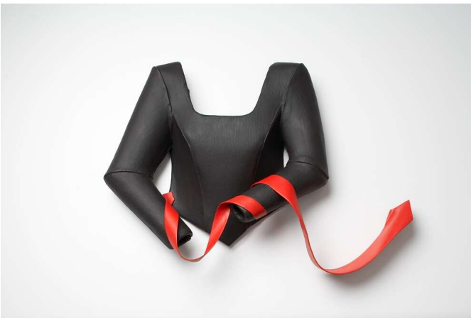
„Rote Krawatte“, 2007 Stoff, Glasfaser, Lack H ca 70 cm